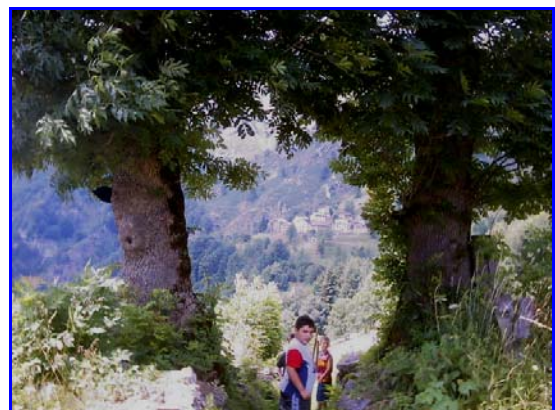
I 2 frassini, imbocco sentiero per Ronco

Domanda quiz: CHI SONO I SANTI RAFFIGURATI NELL'EDICOLA ALL'INIZIO DI RONCO?