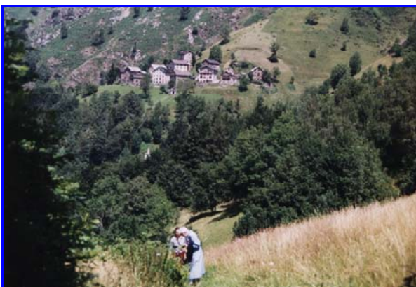
Ronco, veduta da sopra Belvedere