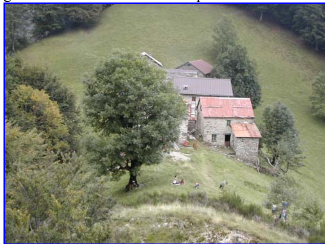
La Colma venendo dal Belvedere

giungendo alla Colma, si attraversa l’abitato e si imbecca il sentiero che sale sul prato dalla parte opposta e entra nel bosco. In 10 minuti, stando sulla cresta, si giunge su uno sperone roccioso da cui si gode di una vista unica. Sotto passa la strada della Val Mastallone, all’incrocio tra i due torrenti.