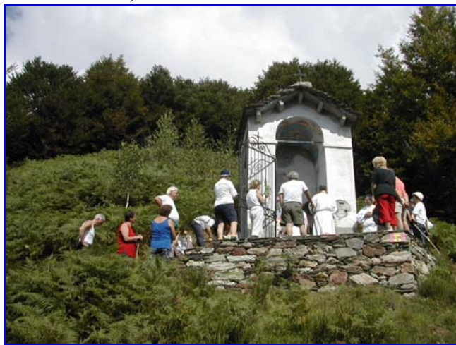
La Messa a Santa Barbara